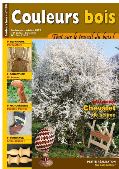
Couverture Couleurs bois n°104